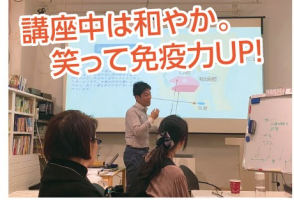
講座中は和やか。 笑って免疫力UP!