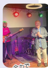
全力で「全カ少年」歌います!

前半 18:30~19:30 ◆片平式ボイトレトレーニング実践 ◆エントリー者による歌唱