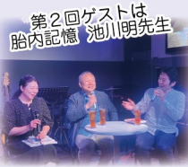
第2回ゲストは胎内記憶 池川明先生